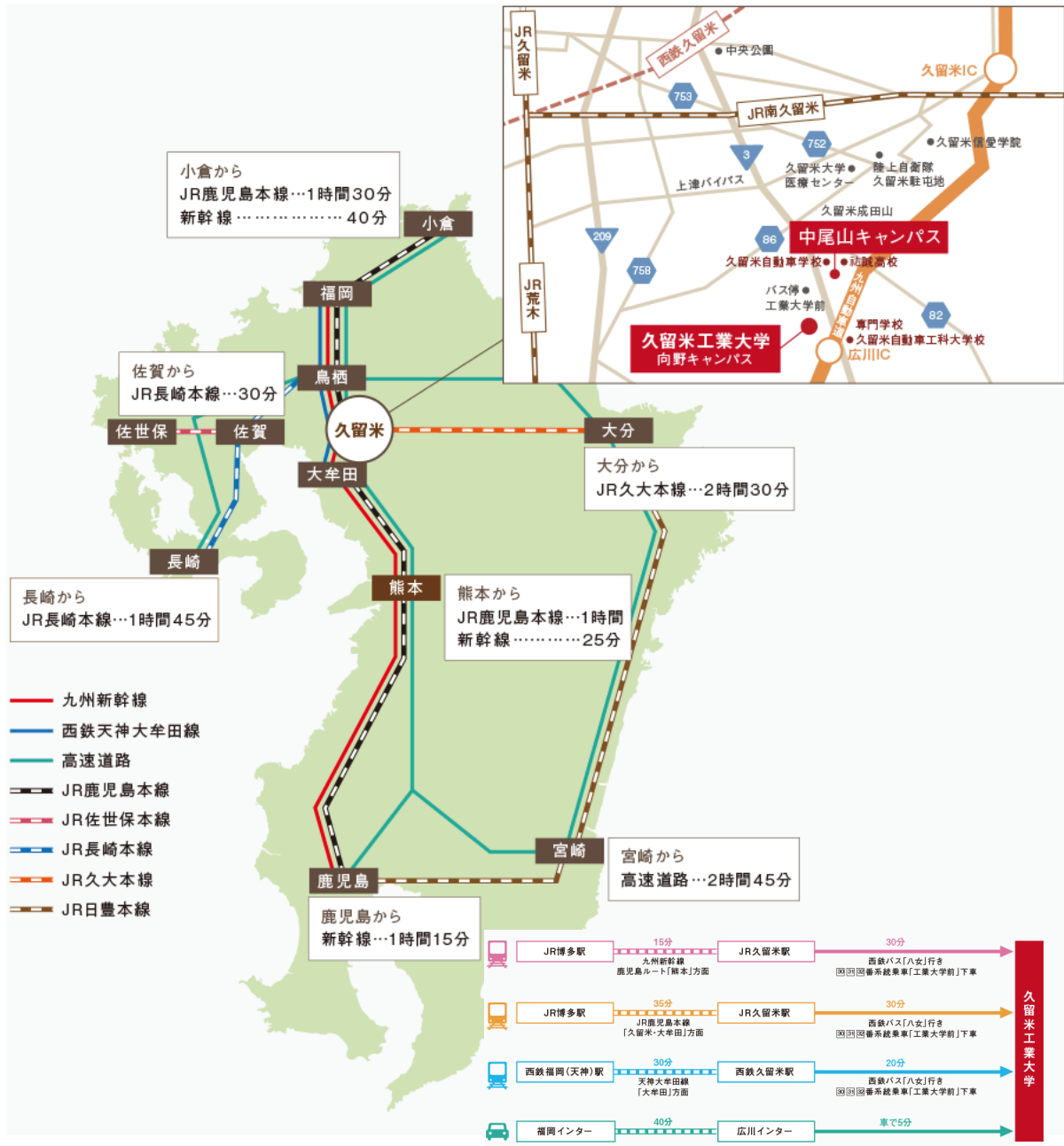
図 2-5-1 本校へのアクセスマップ