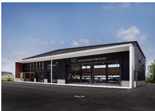
航空宇宙実習棟(AEC)全景

・本実習棟では、2階に配置した講義室で航空宇宙工学の理論等を学ぶとともに、1階の実習施設においてセスナ機等の実機を用いた実習を行っている。理論と実践を同時に学ぶことによって、航空宇宙産業で必要とされる技術を身に着けた人材育成を目指している。