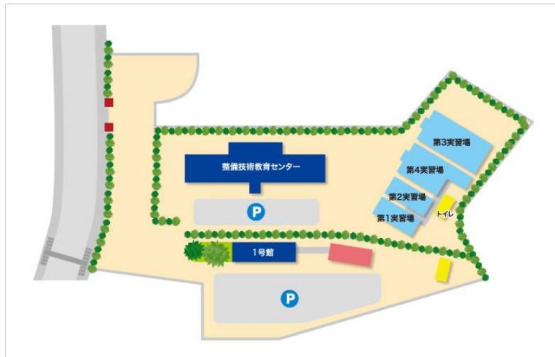
図 2-5-2 向野キャンパス（上段）及び中尾山キャンパス（下段）配置図